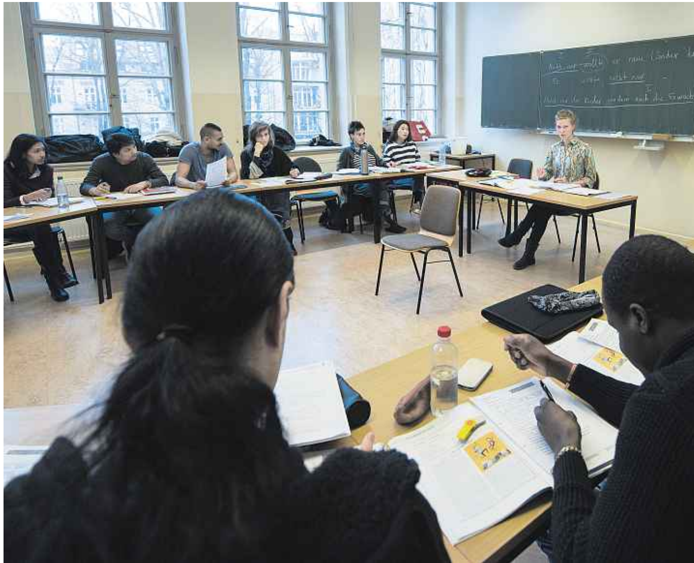
Vorrang für Integration. Stark beansprucht werden Volkshochschulen durch Deutschkurse für Geflüchtete. Die Kritik, das führe zur „Gesamtberliner Sprachenschule“ und dem Wegfall anderer Angebote, weist der Direktor der VHS Mitte zurück.

Kein ausreichender Spielraum also für die Neuerung der Berliner Volkshochschulen? „Mit dem Geld kann man keinen